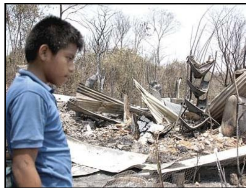
TANKANHUITZ, SLP. ¿Por qué pasó esto?

Sus donaciones en especie pueden ser entregadas a partir del próximo lunes en la calle Godard Núm. 20, Colonia Guadalupe Victoria, a una calle del metro la Raza, Tel/fax: + (52) (55) 53564724 y 53560599.